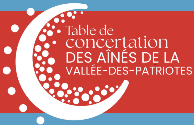
Table de concertation DES AÎNÉS DE LA VALLÉE-DES-PATRIOTES